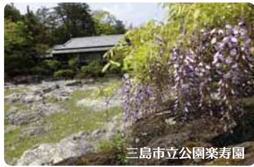
三島市立公園楽寿園

온시하코네공원은 1886년, 황실 피서지와 국빈을 모시기 위해 건설된 ‘하코네 이궁’ 궁터에 조성된 공원입니다. 이궁의 건물은 두 번의 지진으로 무너졌지만 건물의 기초(초석)와 이백 계단 등 여러 흔적이 아직 남아 있습니다. 현재의 호반전망관은 하코네 이궁을 본떠 만들었는데, 이곳에서 보는 풍경은 과거 당시와 거의 변하지 않아 웅대한 후지산과 아시노코 호수의 뛰어난 전망, 아름다운 정원, 벚꽃과 산나리 등 사시사철 피는 꽃과 단풍도 아름답습니다.