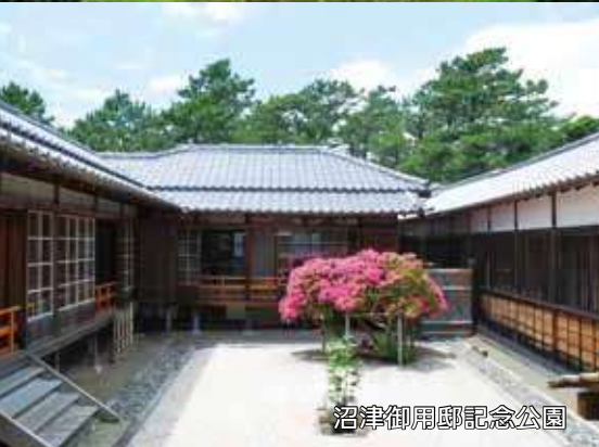
沼津御用邸記念公園