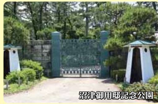
沼津御用邸記念公園

지치부노미야 기념공원은 1941년부터 사용된 ‘지치부노미야 야스히토 친왕 전하 별저’ 옛터에 만들어진 공원입니다. 지치부노미야 세쓰코 비전하가 1995년 서거했을 때의 유언에 따라 고텐바시에 기증되었고, 정비 후 2003년에 지치부노미야 기념공원으로 문을 열었습니다. 초가지붕으로 된 별저 안채(약 300년 전 축조)는 고텐바시의 문화재로 지정되어 있습니다. 또한 이 안채를 감싸듯이 피는 수령 130여 년의 수양벚나무에는 모든 사람의 마음을 사로잡는 힘이 있습니다.