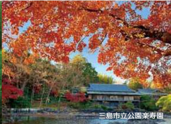
三島市立公園楽寿園